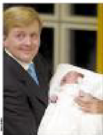
El príncipe de Holanda, con su hijo,