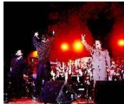
Quipildor y Cura desplegaron calidad y carisma.